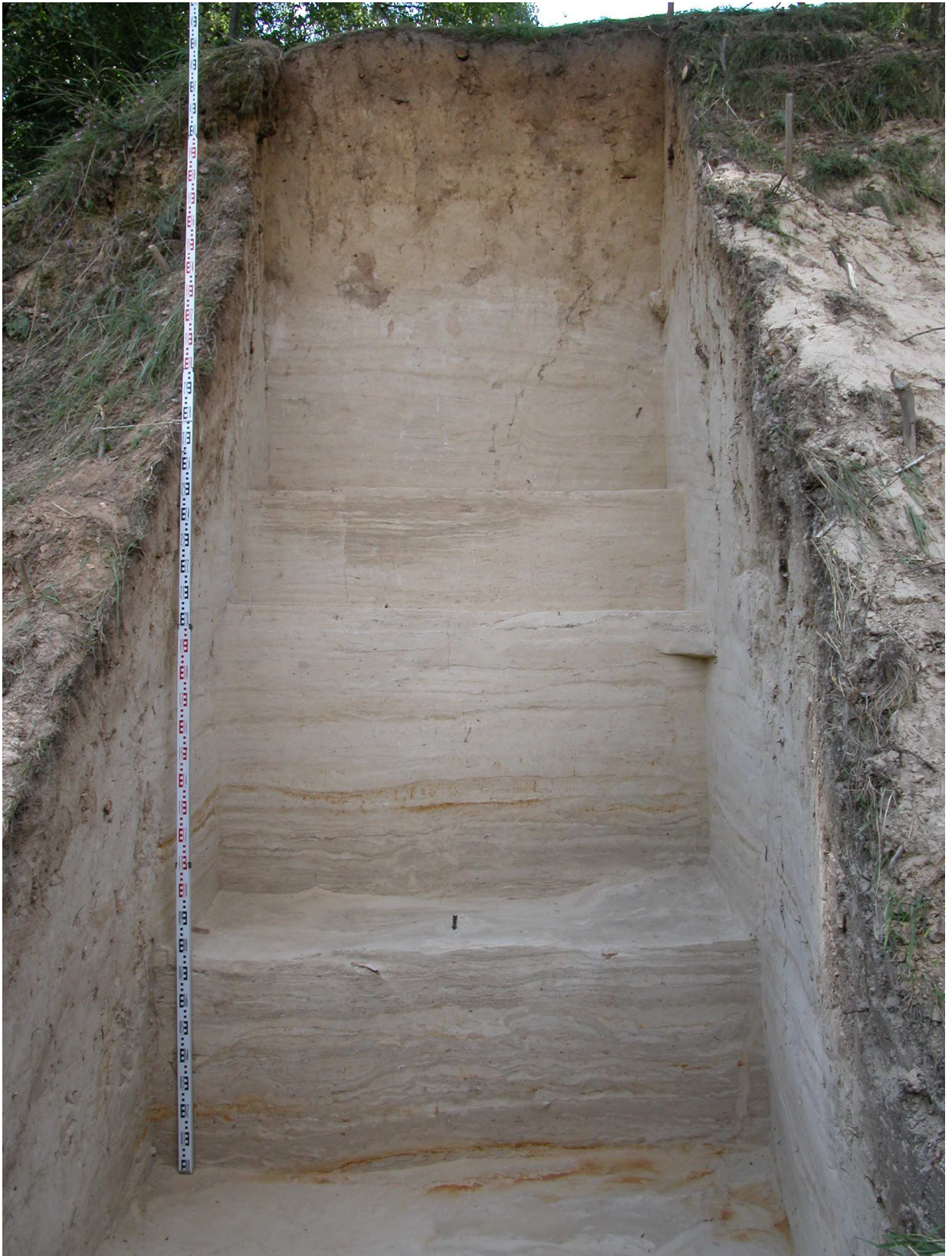
Coupe stratigraphique au niveau du site archéologique avec les deux niveaux d'occupation