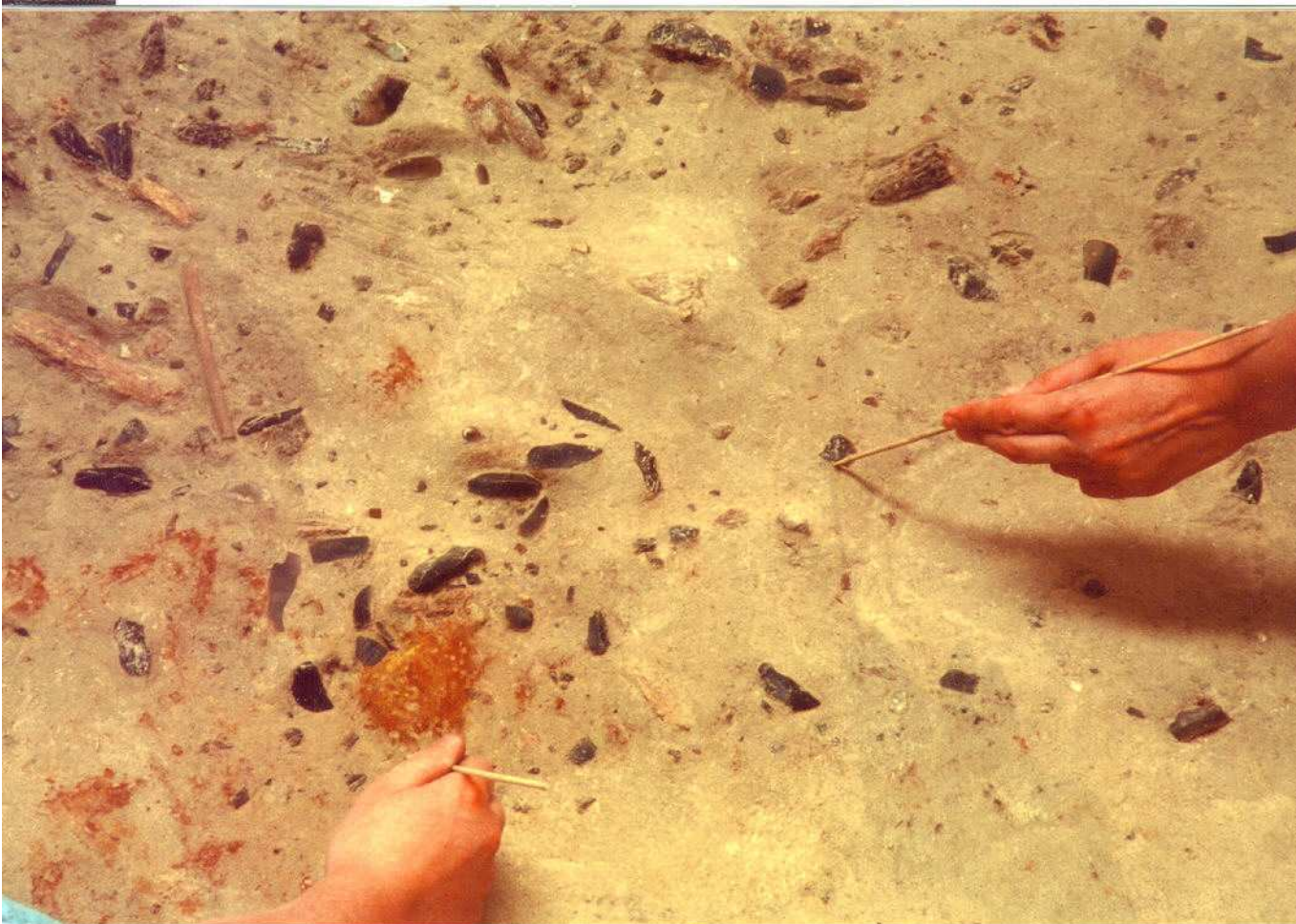
Détail d'un décapage du sol d'occupation (artefacts en silex et en matière dure animale, coquillages, tâches d'ocre, pierre, débris d'ivoire)