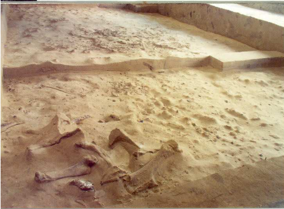
Sous le hangar n° 1 : Structure d'habitat n° 3 du niveau inférieur au premier plan et grands foyers du niveau supérieur au second plan