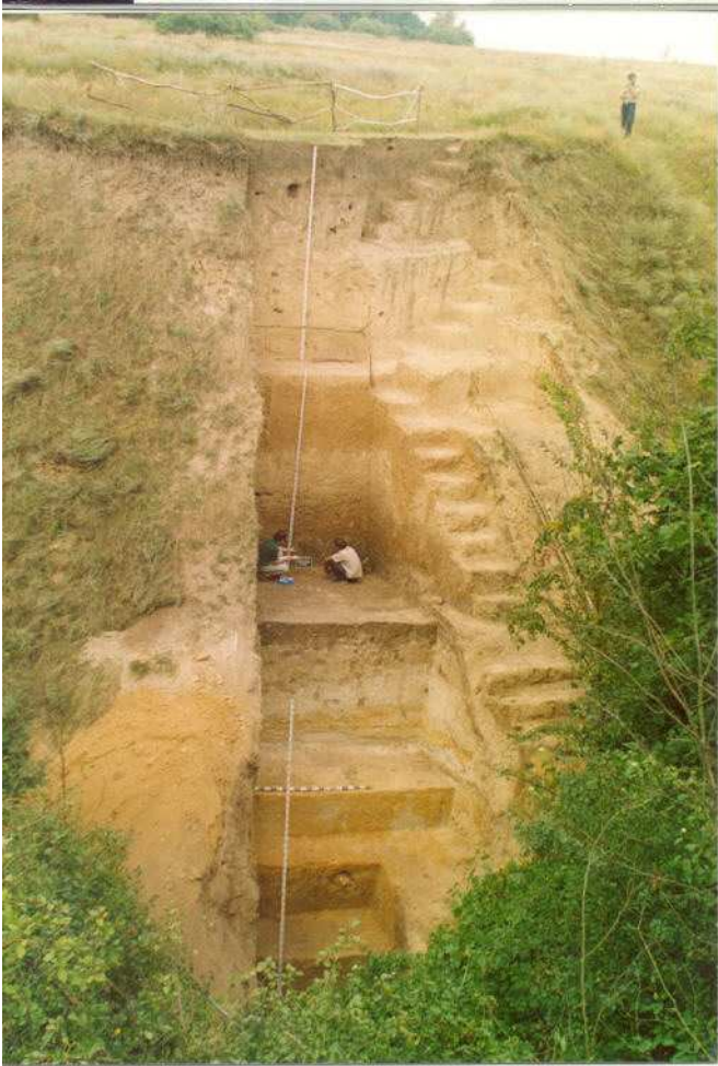
La grande coupe en haut de la ravine avec la séquence loess et sols fossiles des derniers 200 000 ans