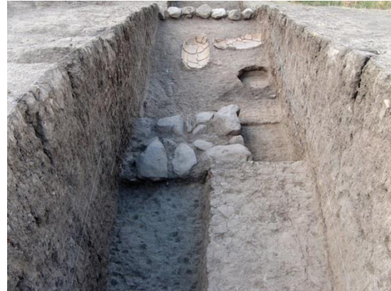
Vue générale chantier D