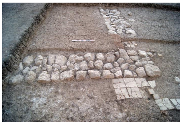
2012 : vue générale chantier