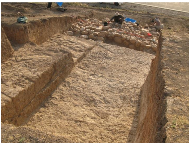
Cour bâtiment monumental dégagé en 2012

Le chantier A correspond à une tranchée stratigraphique sur la ville haute. Cette année il a également permis d'élargir la fouille d'un bâtiment du niveau 2 qui couvre vraisemblablement l'ensemble de cette éminence. Ainsi avons-nous dégagé au nord de la cour mise au jour en 2012, une pièce qui constitue l'angle nord-est de l'édifice. Dessous (niveau 3), la fouille a révélé un premier bâtiment imposant dont le mur extérieur est pourvu de redents. Chacun de ces deux niveaux principaux comprend deux phases d'occupation avec des sols distincts et de légères modifications du plan des pièces, le périmètre extérieur demeurant plus ou moins identique. La fouille des pentes du tell a mis en évidence un aménagement avec des rampes d'accès munies d'escalier.