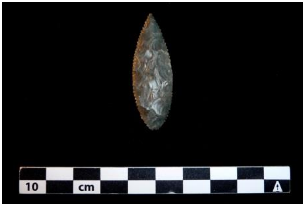
Pointe de flèche Akkadienne

Le but du chantier D quant à lui était de vérifier si Kunara était ou non équipée d'un système défensif. Ce chantier était également destiné à préciser la relation stratigraphique entre les deux éminences principales. Dans ce but, deux tranchées ont été implantées sur les contours de la ville basse, l'une à l'ouest et l'autre au sud. La première a livré une succession de quatre niveaux d'occupation domestique et artisanale sur une dénivellation de plus de 8 m, les trois premiers étant séparés du plus ancien par un niveau d'abandon. Les trois premiers niveaux seraient contemporains du niveau 2 identifié dans les autres chantiers tandis que le quatrième pourrait bien correspondre au niveau 3. Dans la deuxième tranchée, deux niveaux d'occupation domestique ont été dégagés, l'un représenté essentiellement par un sol construit et l'autre par des bâtiments aux murs de 50 cm de large et des sols riches en céramique.