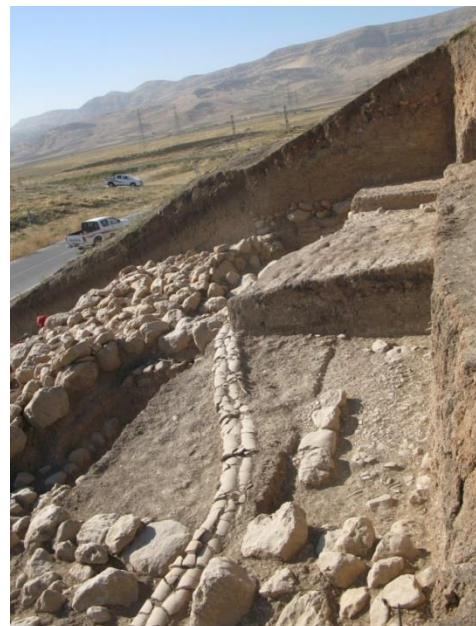
2013 : pièce d'angle du bâtiment.....